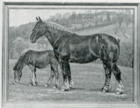
Thür. Kaltblutstute Debra v. Zöthen. Z. u. Bes. Schick-Zöthen. Ölgemälde von Kunstler W. Ueberrück-Breslau.