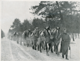
Mit Schleswiger bespannte schwere Batterie auf dem Marsch.