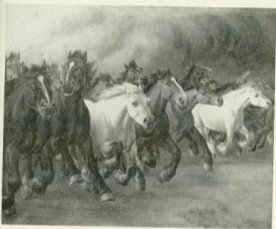
„Gewittersturm“ Ölgemälde von C. Debuscher