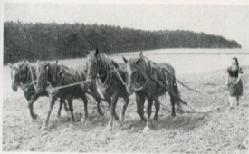
Auch mit 4 Kaltblütern schafft es die Erntebefrei. Sovietische Hauptstammbuchstute der Zucht Neuhof (Badenland). Beim Lichtbildpreiswettbewerb 1941 preisgekrönt.