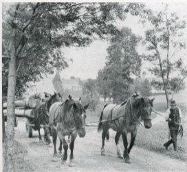
Langholzfuhr. Mit dem 1. Preis des Lichtbildpreiswettstreifen 1941 ausgezeichnet.