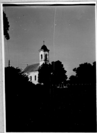
A község legrégibb épülete.