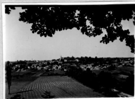
A község látkepe a dobogói határáról. A vast "mester" réti a levőtt sarjrendek.