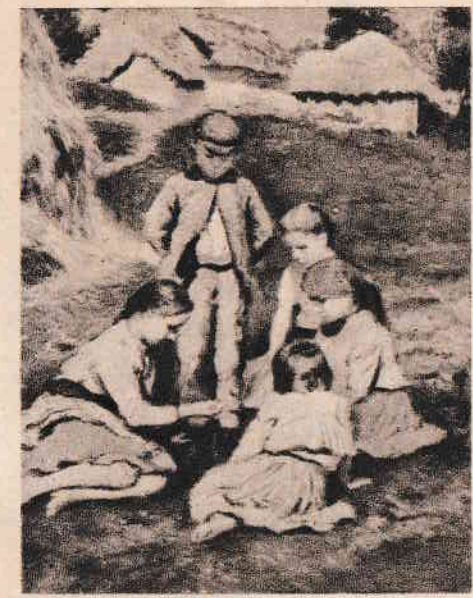
Glatz O.: Kavicsjáték