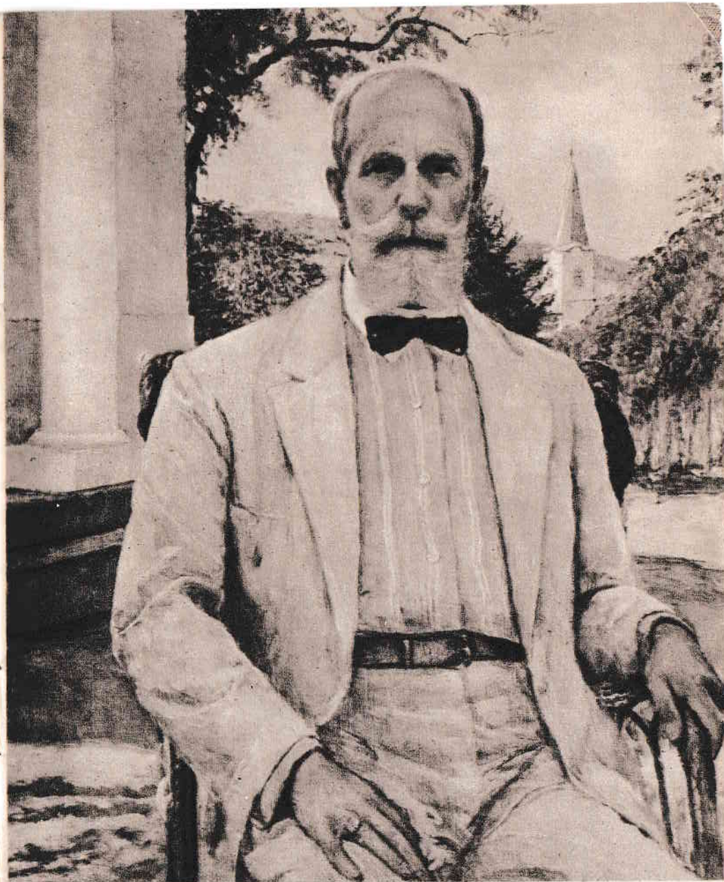
Kunffy Lajos: Önarckép