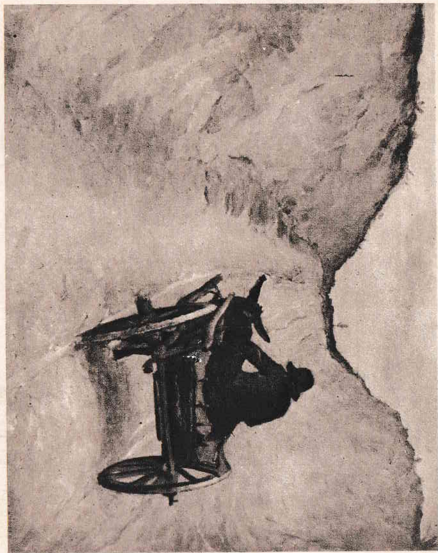
Kunffy Lajos : Hazajele