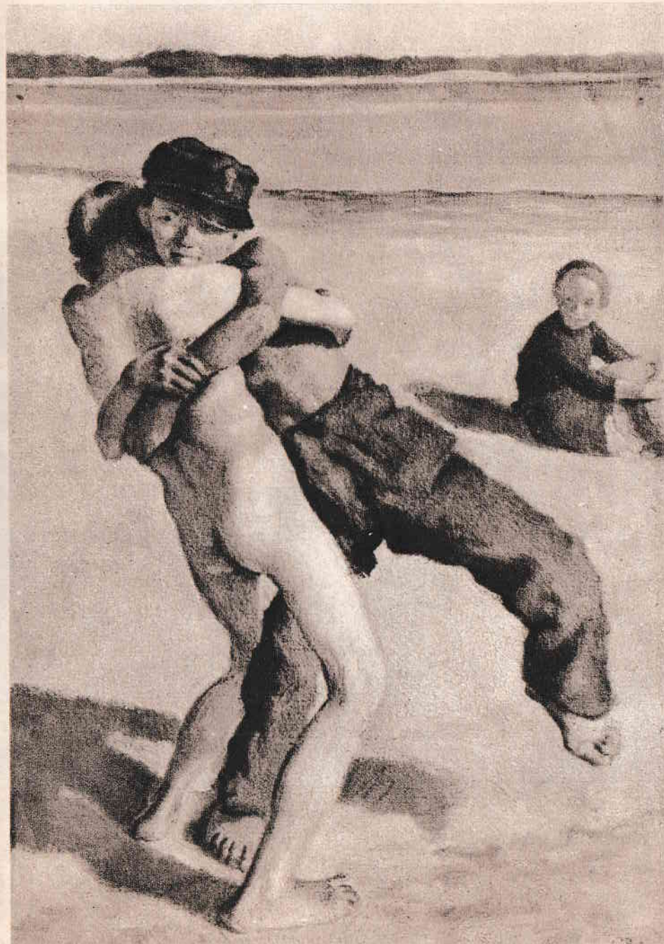
Glatz Oszkár: Birkózók