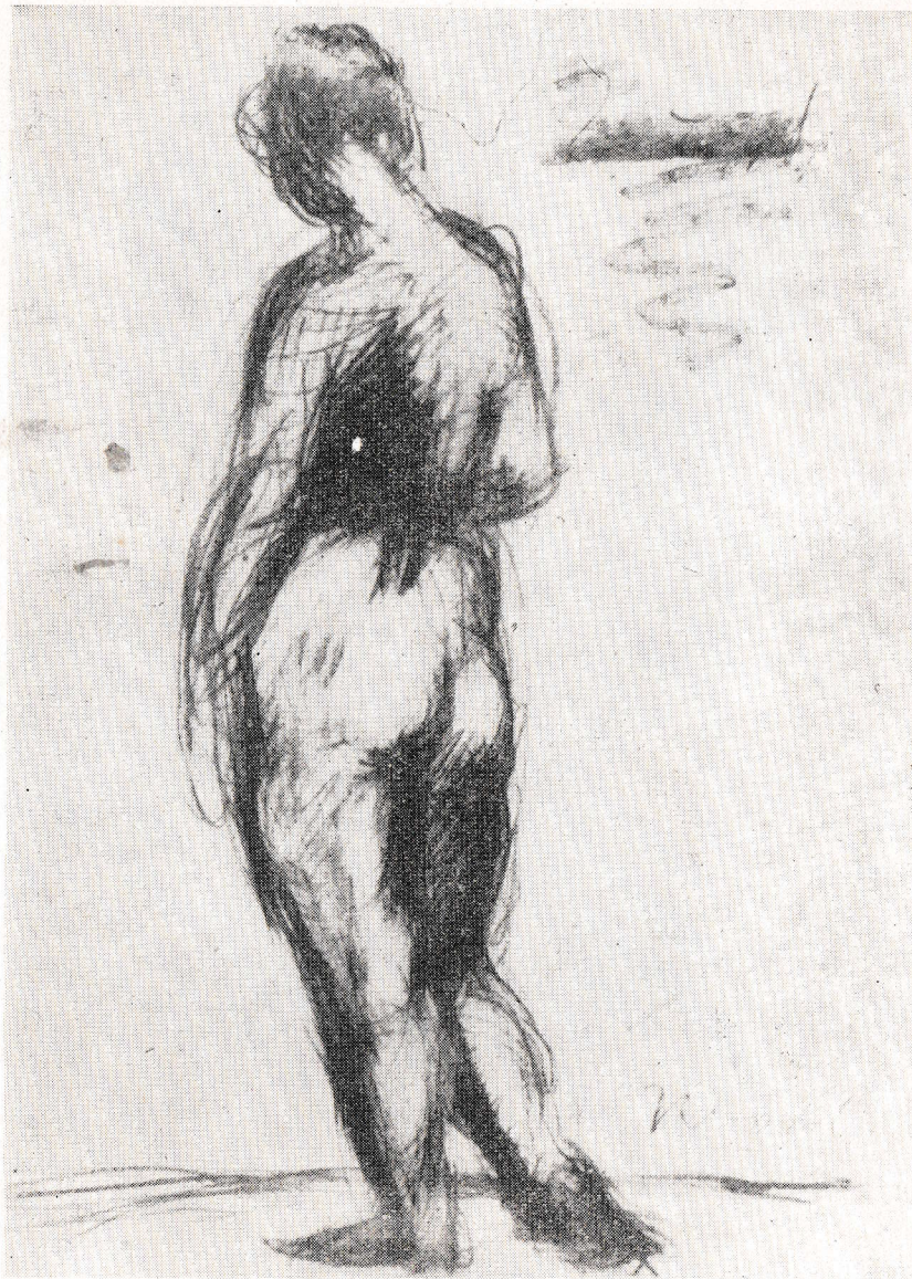
NOVOTNY EMIL RÓBERT: Női akt a Haris-közi szabadiskolában, 1918. (kat. 58.)