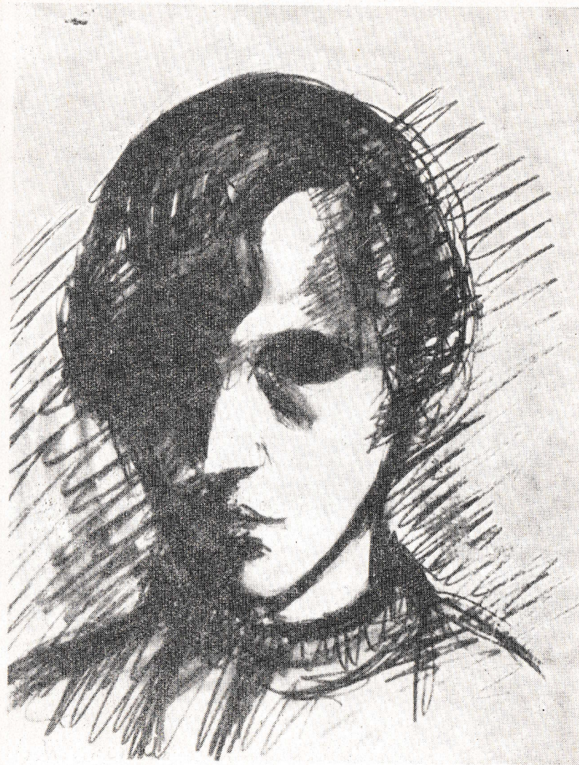
GOSZTHONYI MÁRIA: Önarckép, Nyergesújfalu, 1919. (kat. 68.)