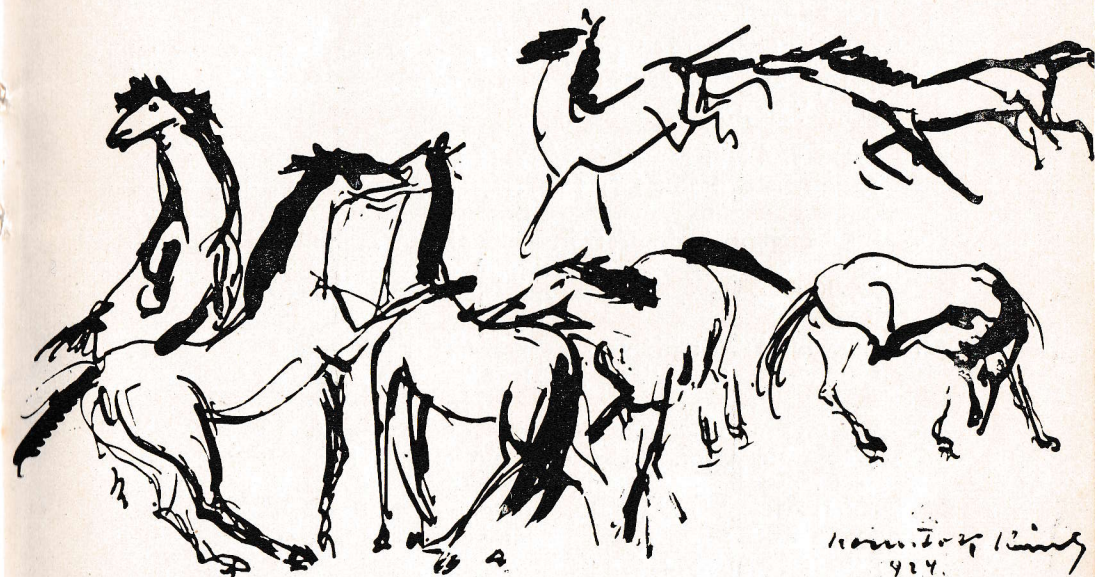
KERNSTOK KÁROLY : Lovak, 1924.