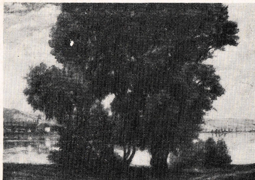
KERNSTOK KÁROLY : Nyergesújfalu, 1915. (kat. 26.)