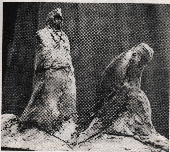
Fusz György kerámia szoborának terve

talmával pontosan megismerkednek a kuratórium tagjai, tisztázódhattak volna a félreértések, félremagyarázások.