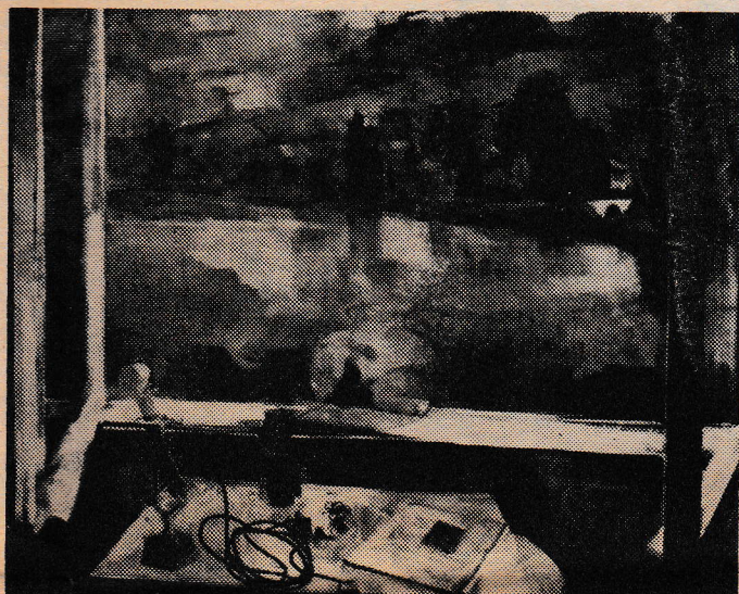
Bernáth Aurél: Reggel