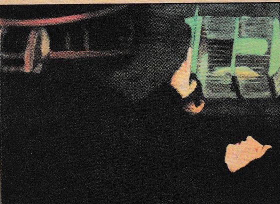
A Kaitikás nő című Rippl-Rónai-festmény 122 millió forintért kelt el