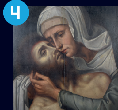
4 Willem Key A Fájdalmas Anya a halott Krisztussal 1520 körül