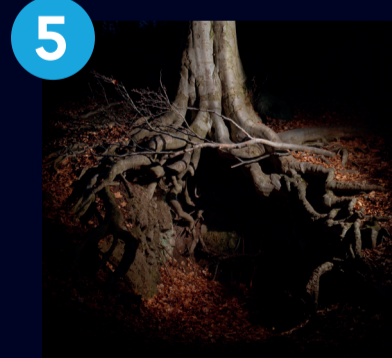
5 Zellei Boglárka Éva Pietà 2021