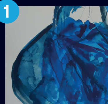
1 Imre Mariann Máriakék (sorozat) 2021