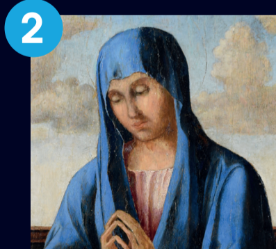
2 Mária a Gyermekkel Giovanni Bellini követője 1500 körül