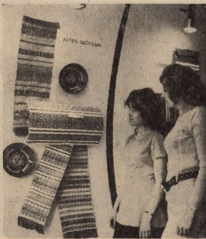
Hetési szöttes és az érdeklődők.