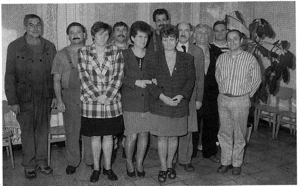
A győri asztalitenisz verseny díjazottjai