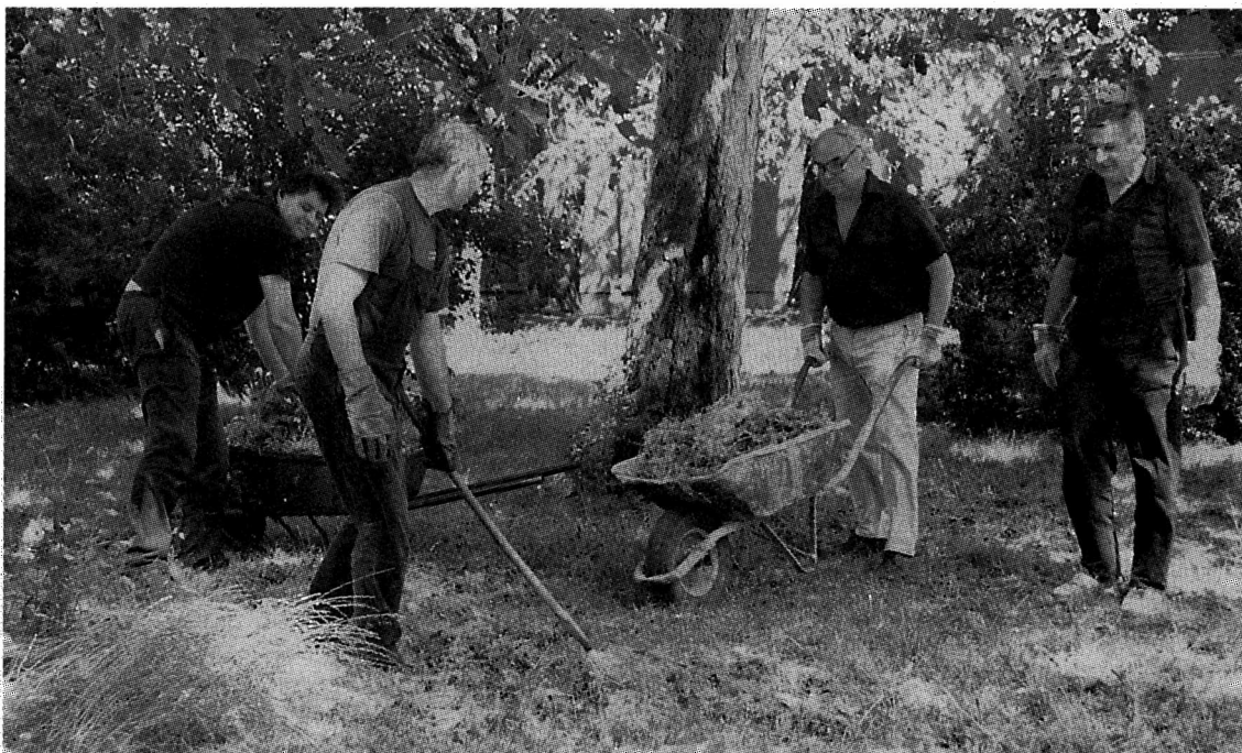
Tisztasági nap a VTG-ben