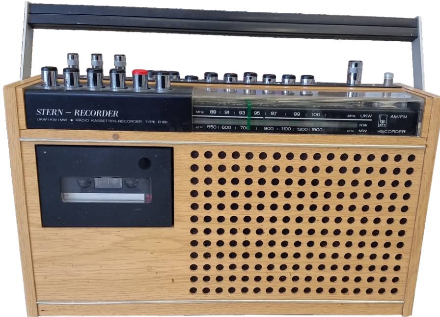
Kofferradio Sternrecorder „R 160“