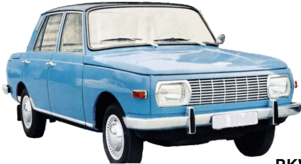
PKW Wartburg 353 mit elektronischer Batteriezündanlage