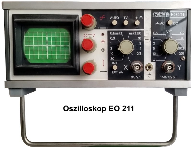
Oszilloskop EO 211