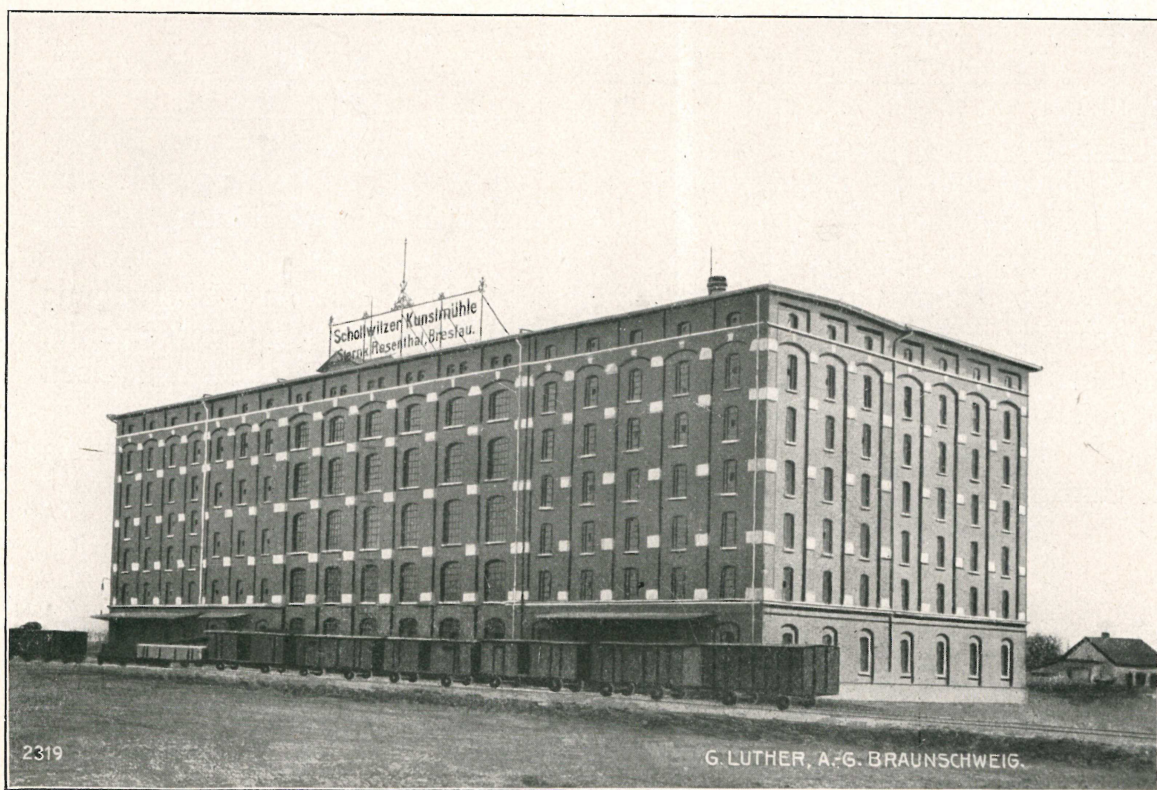
Schottwitzer Kunstmühle, Stern & Rosenthal, Breslau. Leistung: 1500 Sack Weizen und Roggen.